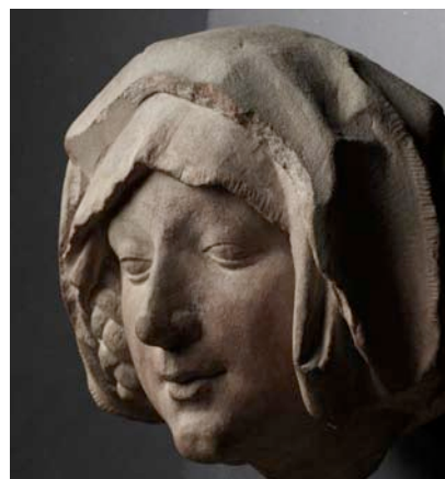
Tête d'une sibylle (fragment du buste de la Chancellerie de Strasbourg), Strasbourg, 1463. Grès rose. Francfort, Liebieghaus Skulpturensammlung.