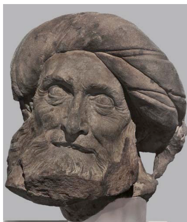
Tête d'un prophète , Strasbourg, 1463. Grès rose. Strasbourg, Musée de l'Œuvre Notre-Dame.

L'exposition regroupe environ 70 œuvres de techniques et de supports variés provenant de collections publiques et privées européennes et américaines (Paris, Berlin, Amsterdam, New York et Chicago). Elle est présentée au sein même du Musée de l'Œuvre Notre-Dame, dont les espaces sont aménagés pour cette occasion. Un catalogue édité par les Musées de la Ville de Strasbourg est réalisé en collaboration avec le musée de Francfort.